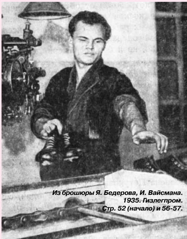
Из брошюры Я. Бедерова, И. Вайсмана. 1935. Гизлегпром. Стр. 52 (начало) и 56-57.

С этого дня Петухов, работая на конвейере один, систематически выполняет норму более, чем на 200%. В один из дней октября Петухов показал рекордную выработку в 1438 пар, т.е. 238% нормы.