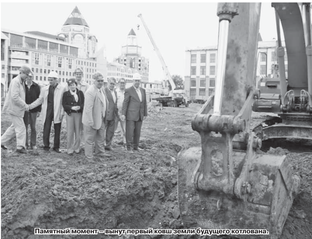
Памятный момент - вынут первый ковш земли будущего котлована.