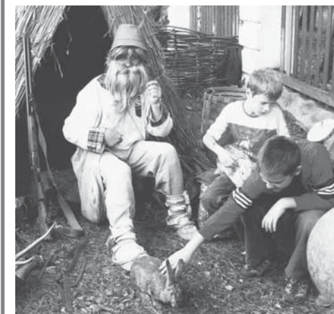
Дед Мазай и зайцы.