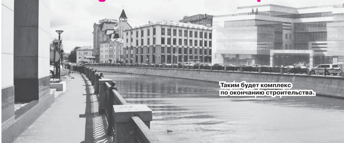
Таким будет комплекс по окончании строительства.