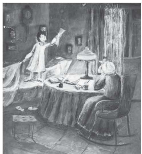
«Наперсница волшебной старины...»