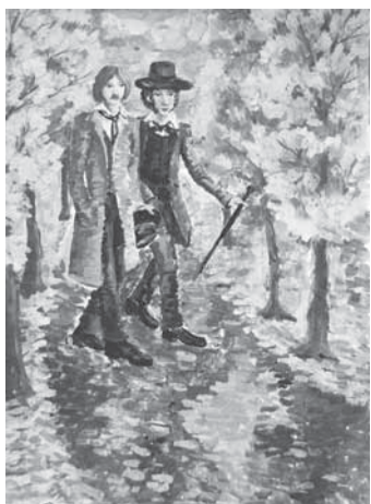
Пушкин и Гоголь.