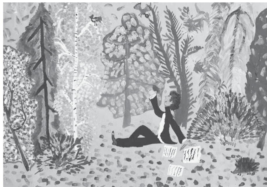
«Люблю я пышное природы увяданье...»