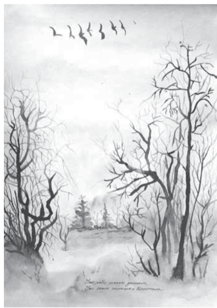
«Уж небо осенью дышало...»

Все заметнее, что многие сюжеты из детства поэта навеяны реальными подмосковными пейзажами, окружающими музей-заповедник, бывшую усадьбу Марии Алексеевны Ганнибал, бабушки поэта по материнской линии. Вместе с отцом Сергеем Львовичем, матерью Надеждой Осиповной (урожденной Ганнибал), с сестрой и братьями Александр Пушкин ребенком бывал в Захарове каждое лето вплоть до поступления в лицей. Исследователи биографии поэта утверждают, что именно с бабушкой Марией Алексеевной он осваивал русскую грамоту. Очевидно, что об этой поре детства он сохранил дорогие воспоминания и возвращался к ним на протяжении всей жизни. В зрелые годы (в 1830 году) решил навестить бывшее бабушкино имение, о чем сохранилось упоминание в письме матери Надежды Осиповны к дочери Ольге Павлищевой, сестре поэта. В лицейские годы (в