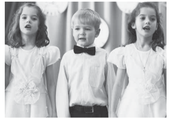
Воспитанники нашего детского сада в 5-м Монетчиковском переулке.

Именно эта — особо нарядная обувь для девочек и мальчиков — делает труд праздником, несмотря ни на что и вопреки всему. Кризису, эпидемии гриппа, напряжению насыщенного плотного графика сдачи моделей,