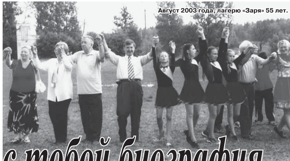
Август 2003 года, лагерь «Заря» 55 лет.