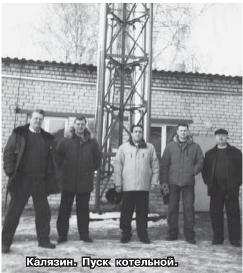
Калязин. Пуск котельной.